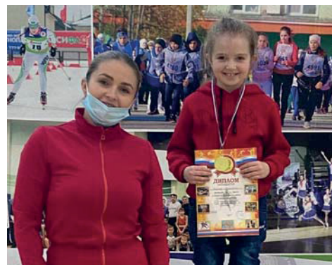
Декада спорта и здоровья стр. 11

ТВ ПРОГРАММА НА НЕДЕЛЮ 07.03 - 13.03 СТР. > 7-8 | 9-10