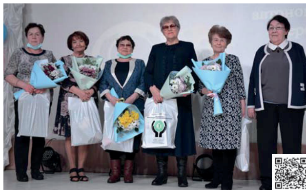
В конце февраля 2022 года Березовскому районному центру социального обслуживания населения исполнилось 25 лет. В день юбилея десятки жителей Березово собрались в районном Доме культуры, чтобы торжественно отметить это знаменательное событие

Неисчерпаемое богатство центра – это его коллектив. Без верности своему делу нет настоящего социального сотрудника. Высо-