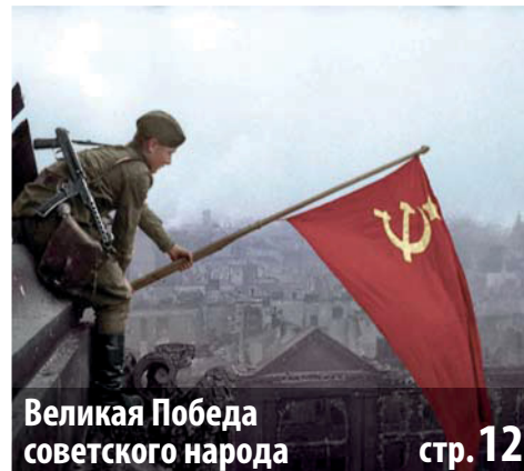
Великая Победа советского народа | стр. 12

ТВ ПРОГРАММА НА НЕДЕЛЮ 09.05 - 15.05 СТР. > 7-8 | 9-10