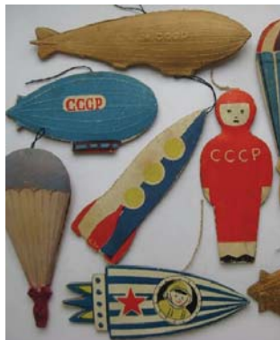
Космонавты и космические ракеты. Новогоднее украшение СССР

К счастью, в 1935 году постановлением правительства запрет на елку был отменен! А уже в 1936 году значимость праздника как символа новой идеологии подтвердила новогодняя елка в Колонном зале Дома Союзов. Кроме того, началось производство украшений, в том числе стеклянных шаров с изображениями Ленина и Сталина. Также магазины заполнились «кремлевскими звездами», пионерами, собаками, птицами, овощами и фруктами, космонавтами, Дедами Морозами и Снегурочками и так далее. Сегодня модно собирать советские елочные игрушки, но они становятся редкостью. Новогодние украшения советского периода привлекают внимание и зарубежных коллекционеров, ведь в новогодних игрушках отражена история нескольких поколений жителей Советского Союза.