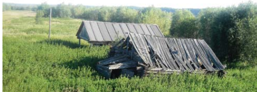
Старый и новый «Большой дом». Д. Вежакары. 2014 г.