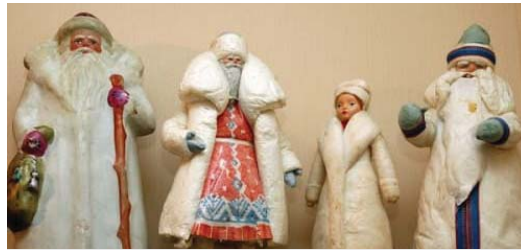
Снегурочка и Дед Мороз сделали из папье-маше. Советские елочные игрушки 1930-1980-х годов