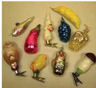
В 1950-1960-х годах появились новогодние игрушки с застёжками в виде прищепок

После Великой Октябрьской революции 1917 года наркомы запретили праздновать Новый год как атрибут Старого Света, а 1 января считали обычным рабочим днем. Однако в некоторых домах елку изредка ставили, а елочные игрушки в СССР найти было непросто. Именно в этот период появилась мода на самодельные елочные игрушки из подручных материалов