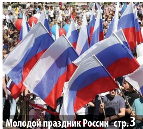
Молодой праздник России стр. 3

ТВ ПРОГРАММА НА НЕДЕЛЮ 13.06 - 19.06 СТР. > 7-8 | 9-10