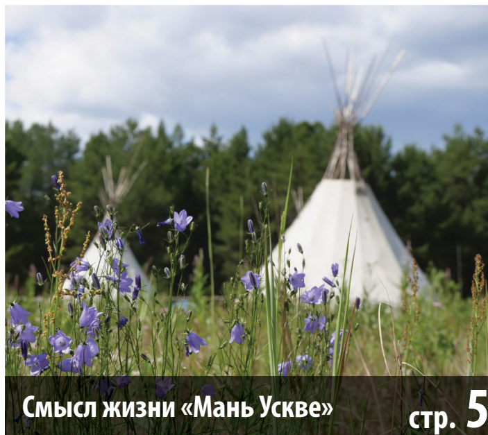
Смысл жизни «Мань Ускве»