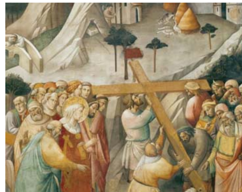
«Сим победиши» стр.12

ТВ ПРОГРАММА НА НЕДЕЛЮ 03.10 - 09.10 СТР. > 7-8 | 9-10