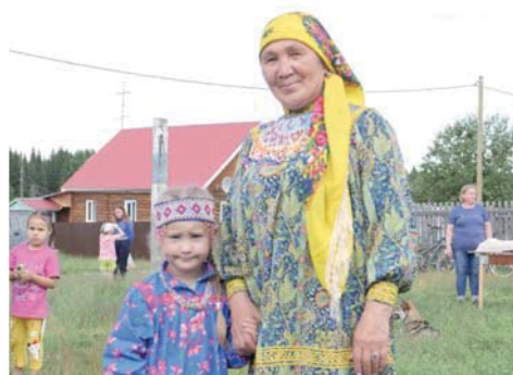
Любителям деревни и рыбалки посвящается... стр. 4

ТВ ПРОГРАММА НА НЕДЕЛЮ 18.07 - 24.07 СТР. > 7-8 | 9-10