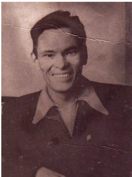
Начало статьи в выпуске №54 от 08.07.2022.