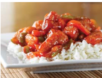
Аппетитная курица в ароматном кисло-сладком соусе - вкусное блюдо китайской кухни, которое можно просто и быстро приготовить у себя дома. Это отличное полноценное блюдо на обед или ужин.