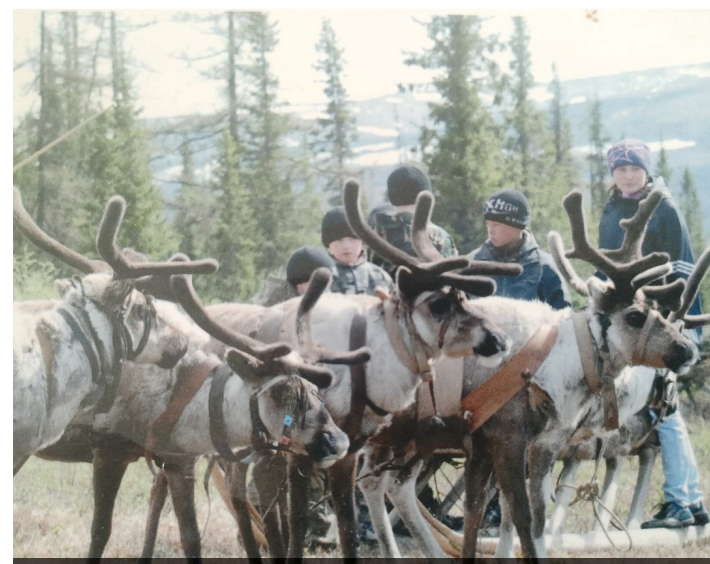
Жизнь оленеводов «кипит» стр. 11

ТВ ПРОГРАММА НА НЕДЕЛЮ 16.10 - 22.10 СТР. > 7-8 | 9-10