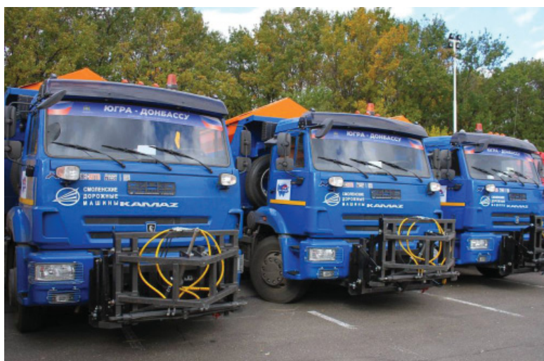
Югра с начала года поставляет в Макеевку специализированную коммунальную технику

жений изменили план восстановления на 2023 год, дополнив его 18 объектами: тремя детскими садами, четырнадцатью школами и больницей, – отметила некоторые итоги проводимой в текущем году работы Наталья Комарова.