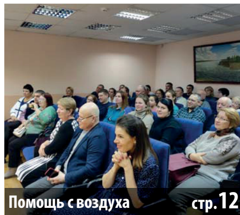
Помощь с воздуха